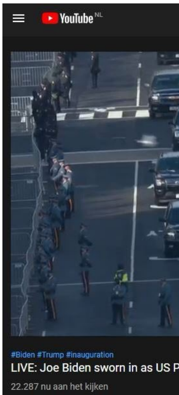
Soldaten keerden Joe Biden tijdens de parade de rug toe.

De Amerikaanse inkomstenbelasting ging naar de Britse Kroon (City of London) en het Vaticaan. Washington DC (District of Columbia), werd een aparte stad-staat (een natie binnen een natie) met een eigen grondwet en eigen vlag. De drie sterren op de vlag verwijzen naar de "three city empire", waarvan Washington DC, Vaticaan-stad en de City of London deel uit maken. Ook Vaticaan-stad en de City of London zijn eigen stad-staten en vormen samen met het District of Columbia het "Empire of the City", in handen van de aristocratie die al duizenden jaren aan de macht is. Ook in